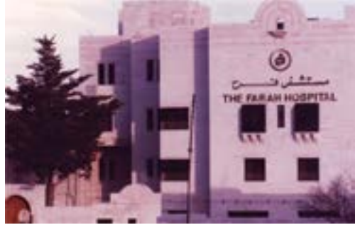
مستشفى فرح ١٩٩٤

بعد ذلك زاد ضغط المراجعين على الدكتور زيد وضاق به المكان فانتقل إلى شارع مي زياده عام ١٩٨٨ وهناك اسسس أول مركز للعقم في الاردن واسماه ذلك الحين مركز الاردن لعلاج العقم ثم مركز الاردن الطبي.