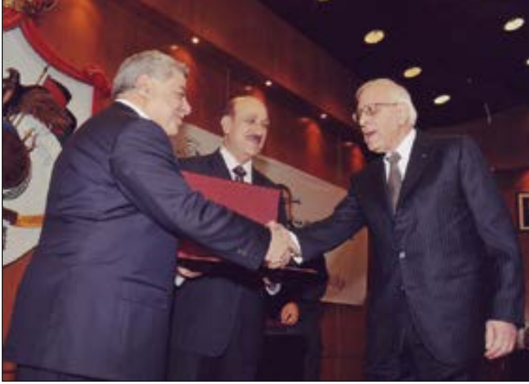
رئيس الوزراء الاردني السابق دولة السيد عون الخصاونة، يسلم الدكتور زيد الكيلاني جائزة الدولة التقديرية، وفي الوسط وزير الثقافة معالي الدكتور صلاح جرار .