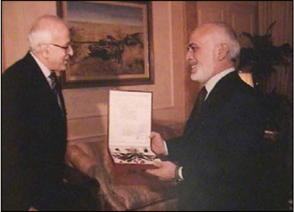
جلالة المغفور له بإذن الله الملك الحسين المعظم يهدي وسام الاستقلال من الدرجة الاولى الى الدكتور زيد الكيلاني