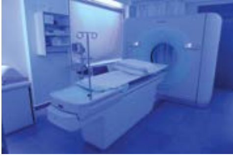
CT - Scan Room