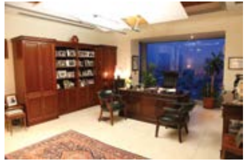
من مكاتب مستشفى فرح