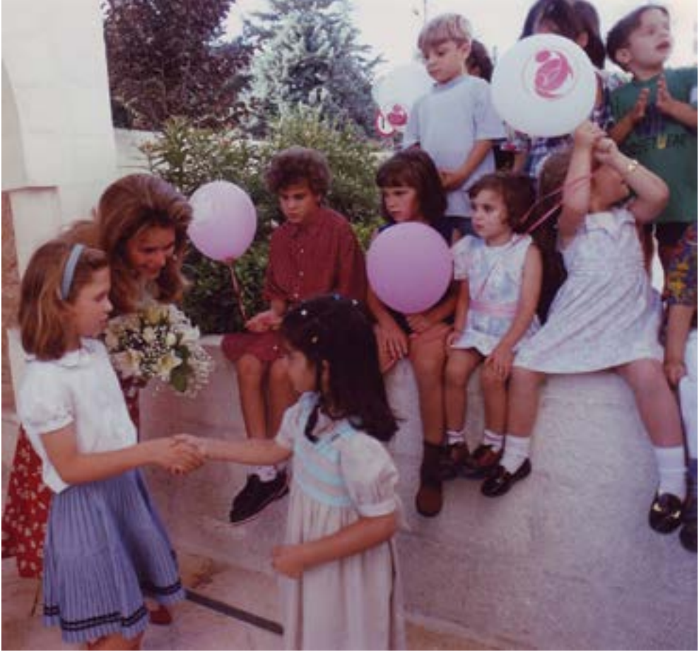
جلالة الملكة نور المعظمة و سمو الأميرة راية بمناسبة احتفال مستشفى فرح بمروور عشرة أعوام على برنامج الإخصاب خارج الجسم ( أطفال الأنابيب )