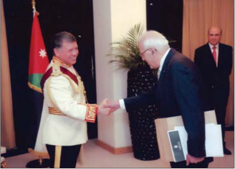
الدكتور زيد الكيلاني يصافح جلالة الملك عبدالله الثاني المعظم بمناسبة تعيينه عضواً في مجلس الأعيان وفي الخلف رئيس مجلس الأعيان دولة السيد طاهر المصري