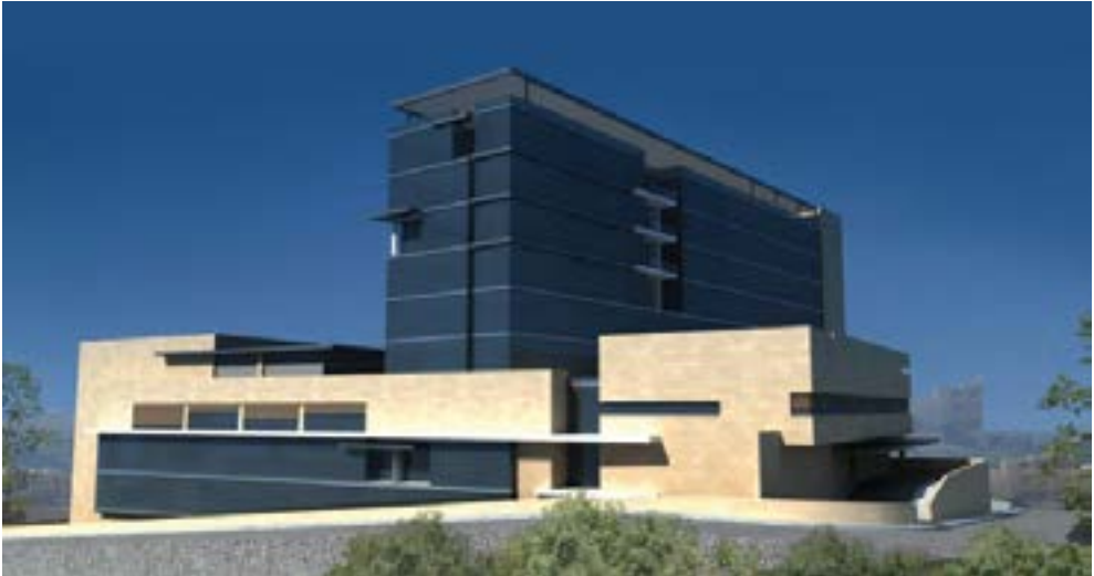
المستشفى العام من مجمع فرح الطبي