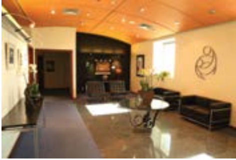
ردهة مدرج المحاضرات

ويتمتع مستشفى فرح بالثقة العلمية والأخلاقية من الجهات الرسمية والعالمية: فلديه الخبرة العميقة والدقة المتناهية والأجهزة الحديثة. ولهذا تمنح بعض الشركات التي لها صدارة في إنتاج الأدوية الحديثة العلاج لبعض من مرضاه مجانا، من الذين تنطبق عليهم شروط معينة، شريطة أن يزود المستشفى هذه الشركات بالنتائج والتي تعرض أحيانا على F.D.A . ( دائرة الدواء والغذاء الامريكية) . أو تنشر في المجلات العلمية للبرهنة على أن هذا العلاج جيد ويستوفي شروط الفعالية والسلامة ويحصل مستشفى فرح على موافقة وزارة الصحة الأردنية قبل تطبيق هذه الدراسات، وكذلك على موافقة لجنة الأخلاقيات المهنية تأكيدا على مصلحة المريض وسلامته .