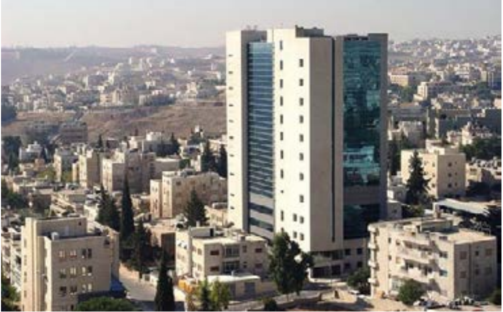
مستشفى فرح الحالي