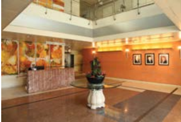
مدخل مستشفى فرح