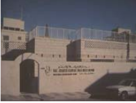
مركز الأردن عام ١٩٨٨

بدأ مستشفى فرح نشأته بعياده صغيره متواضعه بها اربعة مقاعد مستعاره عام ١٩٧٨ وكان ذلك في عيادة الاردن في جبل عمان وموقعها في مايسمى بنزلة رأس العين. في نفس العام، تمت ولادة أول طفل بواسطة الاخصاب خارج الجسم (طفل أنبوب) في العالم Louise Brown. شدّ الدكتور زيد هذا الحدث خاصه وأن طموحاته ليس لها حدود، فبدأ يخطط لإدخال هذه التقنية الجديده الى