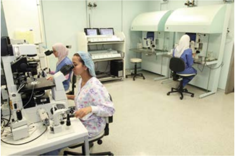
بعض من جوانب مختبرات الاخصاب في مستشفى فرح