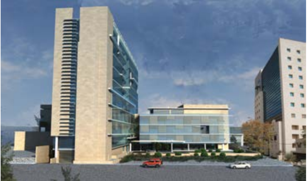
مجمع فرح الطبي